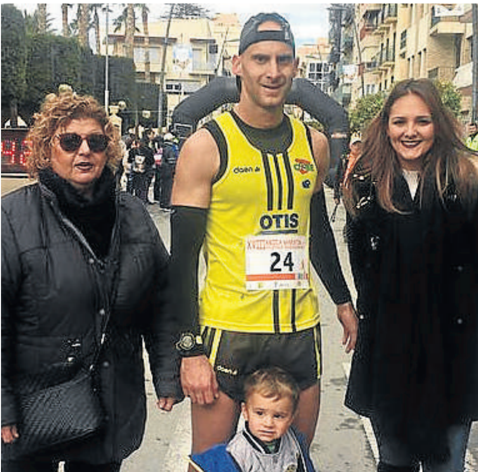
La presidenta hasta hace poco de la Asociación contra el Cáncer de Cuevas junto a la edil de Deportes y el ganador de la general en la Media Maratón.