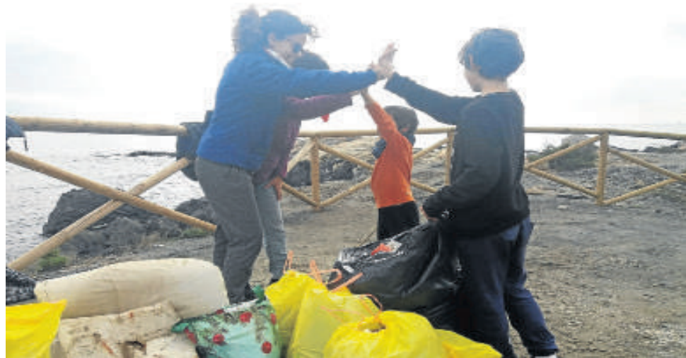
Pequeños y mayores muestran la satisfacción en equipo tras una limpieza en las playas.

Gestos como por ejemplo no dejar basura donde estemos, y recoger aquella que veamos. Así lo proponen con la campaña #cogetubolsa que está teniendo mucho éxito y que invita a todo el mundo a recoger una bolsa que se encuentren tirada cuando salga a pasear, se hagan una foto y la suban a redes. Un poco de cada uno hace mucho.