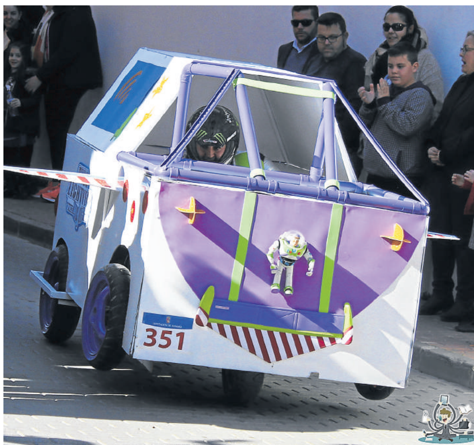
Uno de los vehículos sin motor que participó en la cita con gran originalidad.