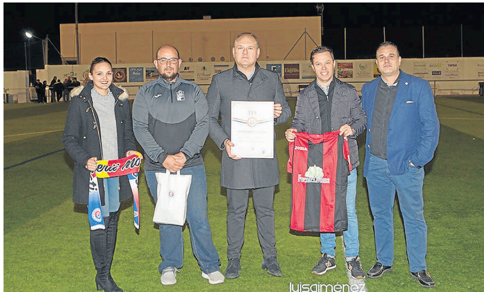
Con los dirigentes del equipo visitante intercambiando presentes.

Con la presentación de los equipos de Cuevas C. F. y con un partido especial tuvo lugar la inauguración de la remodelación del campo de fútbol, en el que se han invertido más de 150.000 euros para la ampliación de vestuarios y otras mejoras, financiado por Junta y Ayuntamiento.