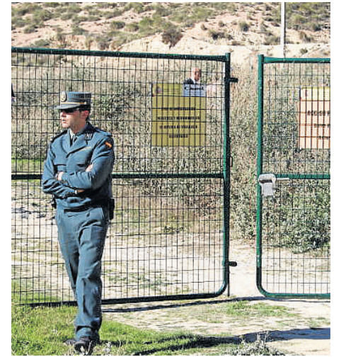
Zona restringida en Palomares.

El Consejo de Seguridad Nuclear(CSN) afronta en febrero la renovación de sus miembros para los próximos 6 años, inmerso en un momento político clave sobre el futuro de las centrales en activo, debido a que todas cumplirán los 40 años de vida útil entre 2021 y 2028.