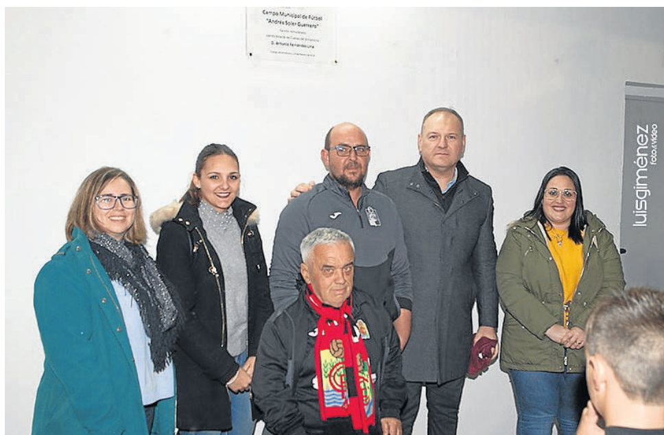
Tras el descubrimiento de la placa de la inauguración de la remodelación del campo de fútbol.