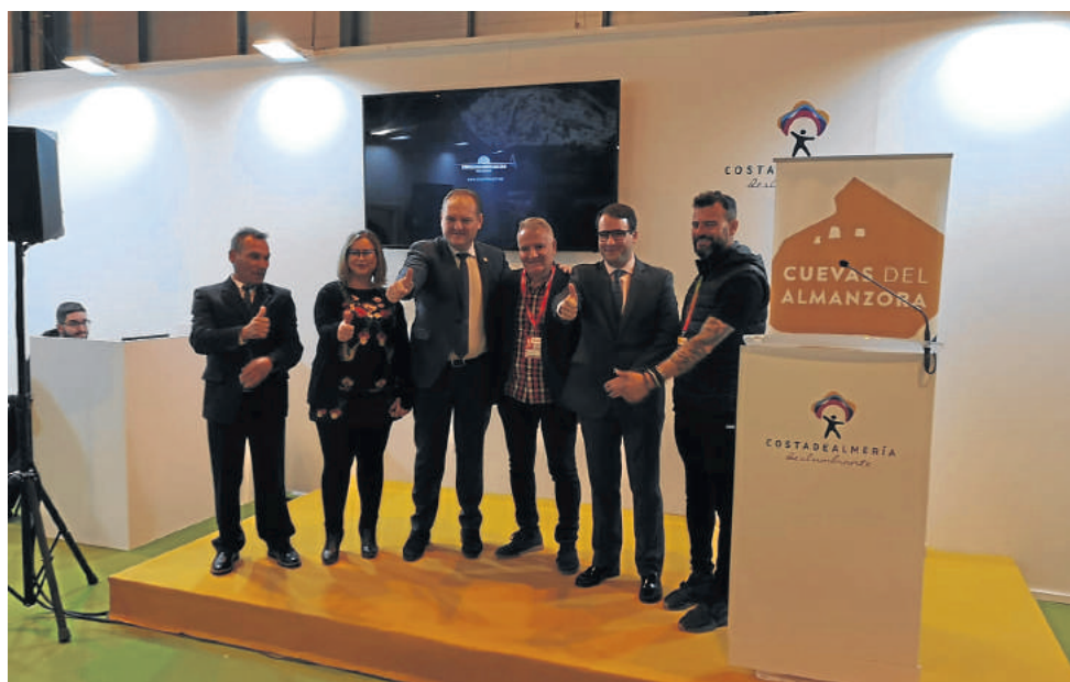
Autoridades con representantes de la organización de Dreambeach en FITUR 2019.

otro de sus grandes reclamos turísticos, la combinación de la costa con un festival de los más grandes del ámbito nacional en música electrónica que se ha consolidado como la cita del verano, Dreambeach 2019.