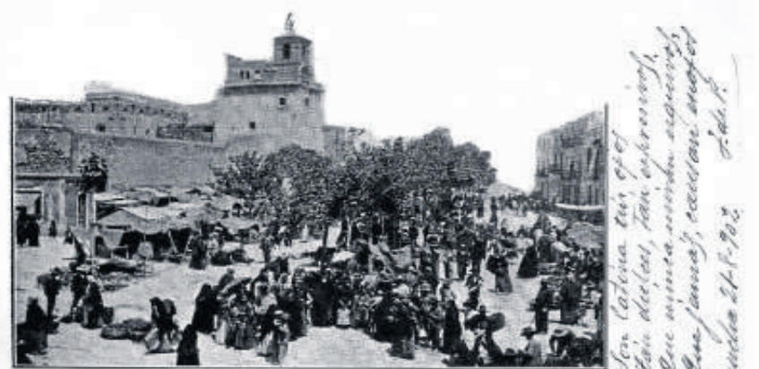
Colección EL ALMANZORA, núm. 2. Expos. - Formosa, 6. - Hebró.

Antes de la colocación de este reloj sobre la torre del homenaje, existió allí un campanario o vela que albergaba una campana citada por los inventarios más antiguos del castillo, en los que se le asignaba un peso de unas seis arrobas (70 kilos). Con ella se tocaba a rebato para avisar a la población cuando desde las torres vigías de la costa columnas de humo, durante el día, o luminarias, por la noche, alertaban de la presencia de naves hostiles, comandadas en su ma-