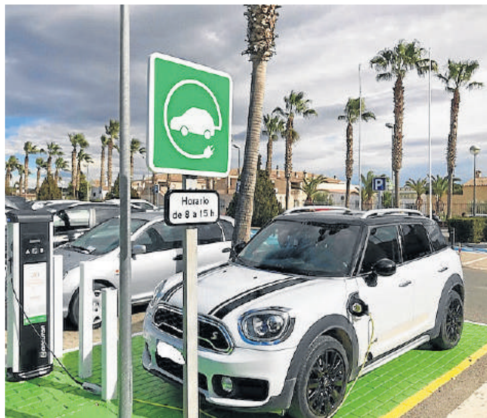
Un vehículo eléctrico cargando en el punto de recarga del hospital huercalense de La Inmaculada

El transporte es la actividad con el mayor consumo de energía en Andalucía y supone más del 37% del total de la energía consumida, con un nivel de