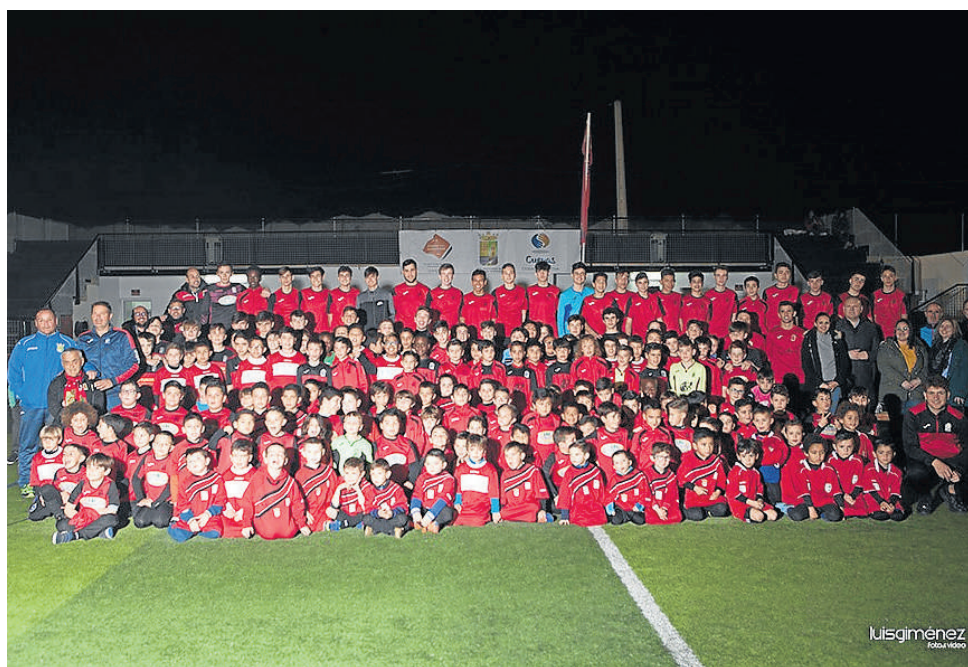
Jugadores, entrenadores y dirigentes del Cuevas C. F. junto a las autoridades locales.