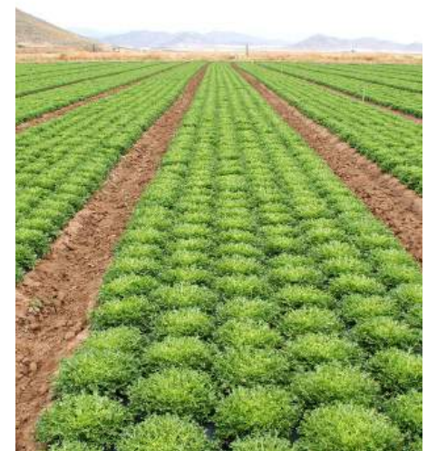
Zonas de cultivo de escarola.