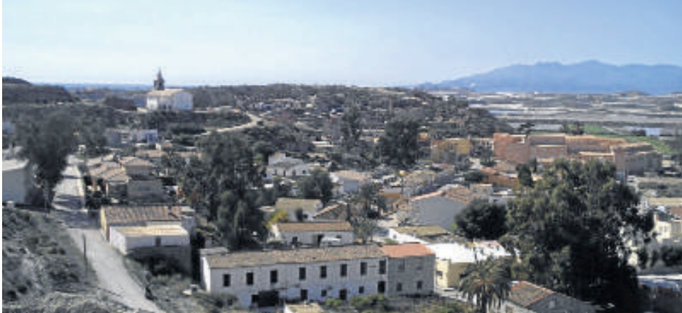
Las Herrerías, en Cuevas del Almanzora.

El Ayuntamiento aprobó en la última sesión plenaria la moción por la que se pone en marcha el mecanismo para expropiar y poner a disposición de la consejería de Educación los terrenos necesarios para la construcción de un nuevo colegio rural en Las Herrerías,