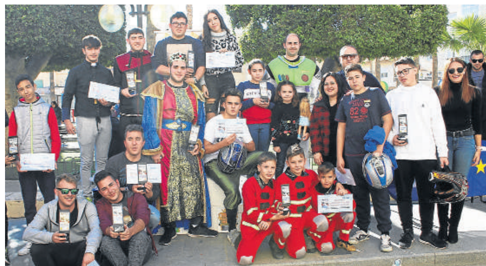
Foto de familia con los premiados del descenso de Karts artesanales sin motor.

El tradicional 'Descenso de Karts artesanales sin motor' contó con un gran éxito, tanto por la originalidad de los vehículos participantes, un total de 14, como por la gran afluencia de público.