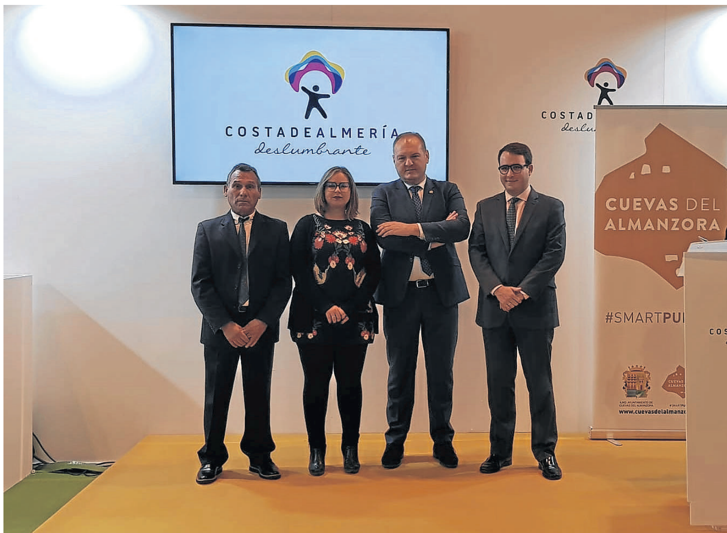
Uno de los momentos de la presentación del vídeo promocional de las playas cuevanas en la Feria Internacional del Turismo (FITUR) en Madrid en este 2019.