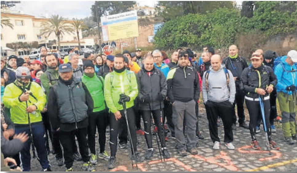
La salida, tanto en bicicleta como caminando tuvo lugar en Overa, y desde allí los deportistas solidarios tomaron camino a Cuevas.