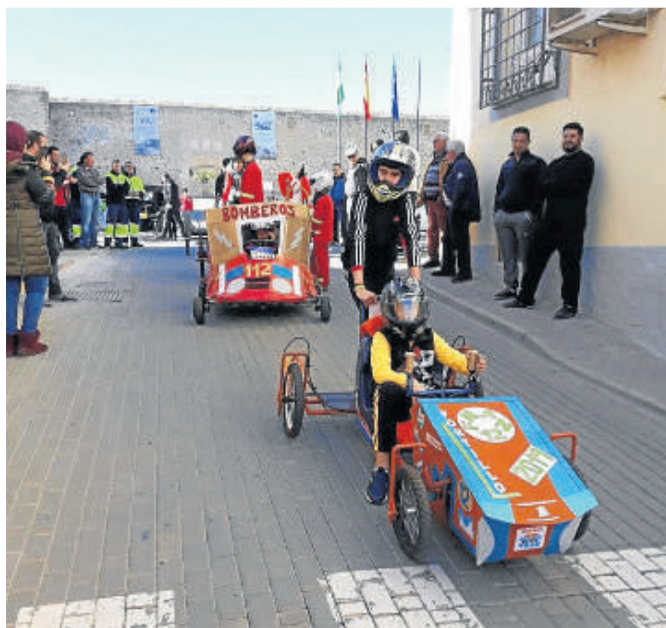
Salida de Karts desde la Plaza de la Libertad para iniciar el descenso.