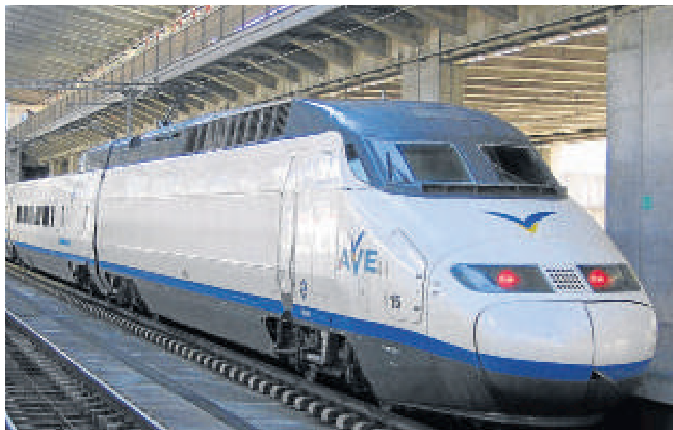
El tren de Alta Velocidad empieza a dar pasos tras siete años de paralización.

La convocatoria de actas previas para la ocupación están fechadas entre el 13 y el 27 de febrero para los vecinos del Levante almeriense